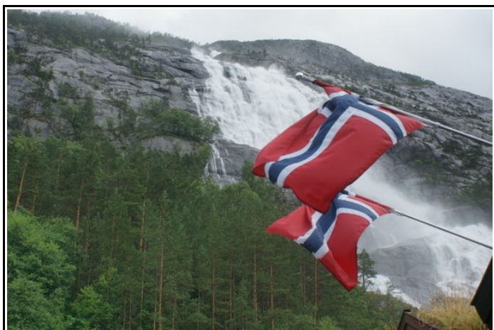
Suurem osa Norrast on mägine, kus allalaskuvad lumeveed moodustavad suuri koskesid. Koskede juurde on ehitatud hüdroelektrijaamu ja samuti turistidele peatuskohti.