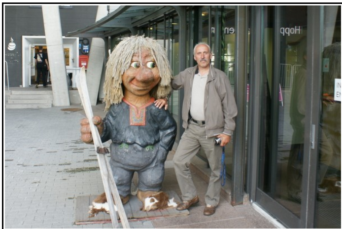
Trollidest on palju lugusid ja legende, nad on Norra maskotiiks. Pilt on tehtud Holmenkolleni hüppemäel, Trolli kõrval seisab loo autor.