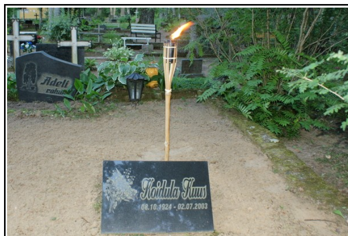
15. juunil jäi Rõuge surnuaias Koidula Kuusi hauaplaadi kõrvale põlema tõrvik, mille tuli oli süüdatud mööda Eestimaad ringelnud üldlaulu- ja tantsupeo tõrvikust.

4.- 6. juulil toimunud üldlaulu- ja tantsupeol said mitmedki meie kandi inimesed siiski peoõhku sisse hingata.