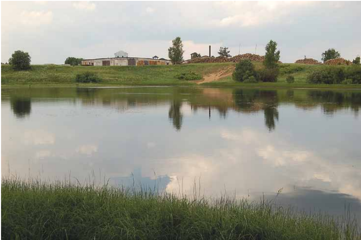
Tsooru järve ääres puudub ametlik sup-lukoht. Praegune koht, kust inimesed lähevad Tsooru järve ujuma, kohandati ujumiskõlblikuks J. M. Sverdlovi nimelise kolhoosi poolt. See asub aga eramaal. Kus hakkab paiknema 15 000 euro eest rajatav Tsooru ujumiskoht, pole teada. Pilt on tehtud 2007. aastal ja vastaskaldal on märgata liivase kaldaga ujumiskoht.

Kõigest järeldub, et Tsooru paisjärvele sup-luskoha rajamisest ei tule lähemal ajal midagi välja, kuid 15 000 eurot on olemas ja ootab mõistlikku kasutamist.