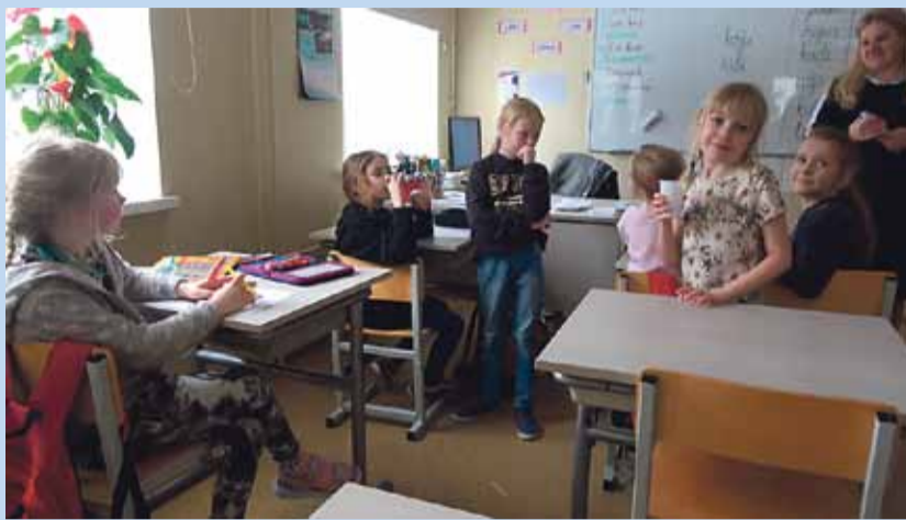
I klassi tüdrukud

Teenetemärgi saamisest lugesin internetist. Direktor teeb oma tööd väga hästi. Kui vaja, tegeleb probleemidega kohe. Ta osaleb ka kooli mälumängus, mida mina korraldan. Mälumäng toimub juba teist aastat, kus osalejad on alates kuuendast klassist. Asjaolu, et on ka õpetajate meeskond ja et ka direktor ise lööb mängus kaasa, meeldib mulle väga ja annab üritusele kaalu.