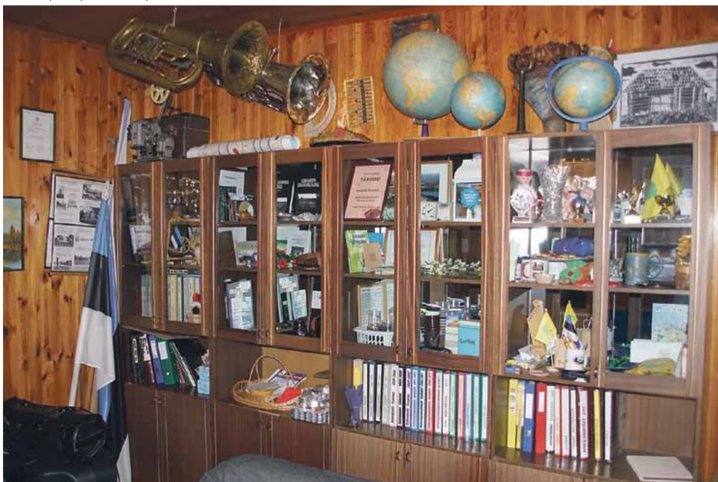
Muuseuminurgake Tsooru rahvamajas. Pilt on tehtud 31. detsembril 2021.