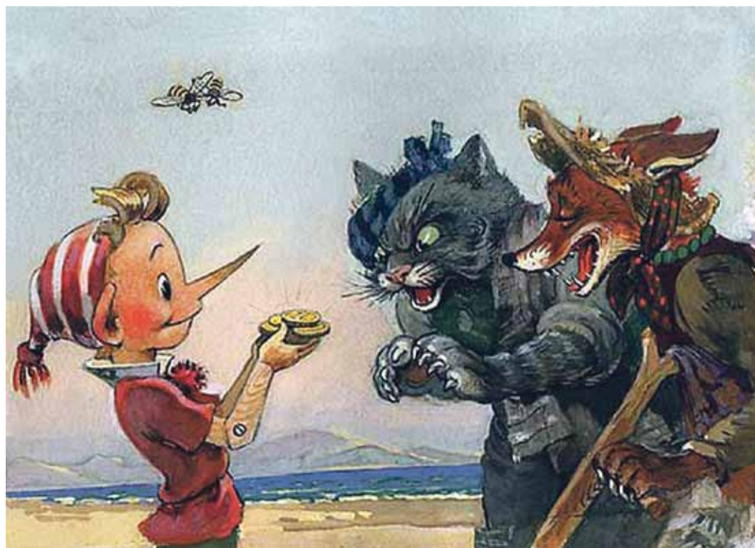
Pilt on võetud facebookist, mis postitatud „Päike polnud veel tõusnudki, kui Lollidemaal käis juba vilgas tegevus“ juurde.