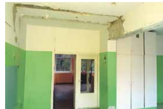
Lusti algkooli ruumid seisavad tühjana juba 15 aastat ja läbi katuse tunginud veed jõudnud esimese korruseni. Pilt on tehtud 17. detsembril 2020.

sest paari kilomeetri kaugusel asuvad Lusti algkooli ruumid on tänaseni tühjad. Iga-aastaselt kulutatakse nende ruumidele talvisel kütteperioodil umbes 5000 eurot. Katus oli niivõrd katkine, et välissademad tungisid läbi lagede kuni esimese korruseni. Lubadustele ja vajadustele tühjaksjäänud ruumidesse laiendada lasteaia pinda ning moodustada erivajadustega laste rühm, on tänaseni lahendamata, kuigi selleks on karjuv vajadus. Õnneks eraldas lõpuks volikogu pärast mitmete volikogu liikmete järjepidevatele nõudmistele raha katusevahetuseks kuid keeldub enamast panustamisest.