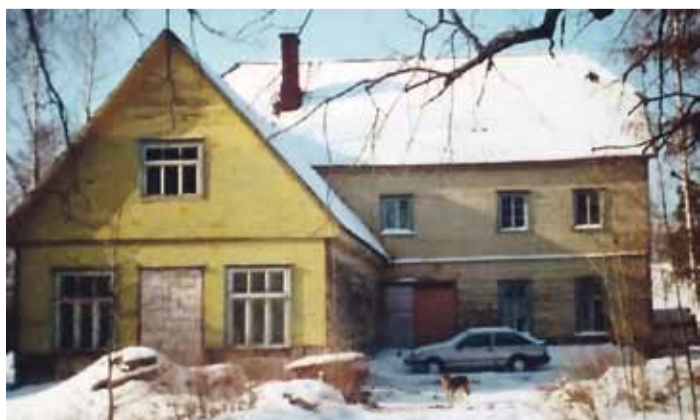
Lusti vana koolihoone sajandivahetusel.

Lusti koolil on olnud veel mitmeid olla või mitte olla küsimusi päevakorras. 1979. aasta kooli alguse olukorrast kirjutab Sirje Aarna nõnda: „... Juba kolmandat aastat on õpilaste arv suur. Trotsitult tuli alustada tööd vanas viletsas majas. Seiad on vajunud, ukseid virilad. Suur 70 m 2 põrandapinnaga ruum on külm, seinad pehkinud, krohv kukub seintel, praht ja tolm