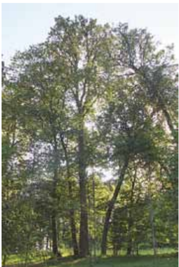
Eesti pikim pärn kasvab Tsooru pargis. Pilt on tehtud 22. juulil 2022.

Olen võrreldes Uma Lehes mitu korda kirjutanud Tsooru mõisapargi puudest, korra ka Eesti Looduses. Uma Lehe toimetaja Ülle Harju ei lubanud mul Tsooru puud nimetada Eesti kõige kõrgemaks pärnapuuks, sest tema teada olevat Sangaste lossi metsapargis veelgi kõrgem pärn. Ülle saatis mulle abiks ühe noore mehe, kelle kasutada olid moodsad mõõteriistad. Tsooru puu mõõdud said üle kontrollitud. Kuid ma pole kusagil kirjanduses leidnud Sangaste pärna mõõtmeid. Minu viimase mõõtmise järgi peaks Tsooru puu olema Võrumaa ja ka Eesti kõige kõrgem pärn. „Eesti rekordite raamatus“ (2014) on kirjas, et Eesti kõrgeim pärn kasvab Erastvere mõisapargis, selle kõrgus on 35 meetrit. Praegu on Tsooru pärn täisjärgus ja -mõõtmega, ega ta suurt enam kõrgusesse kasva, sest 20 aastaga on vaid 1,7 meetrit juurde tulnud. Vanad puud kasvavad jõud-sasti külgoks, ka tüvi muutub jämedamaks, meie pärnal on tüve ümbermõõt suurenenud lausa 40 cm võrra. Sirget oksteta tüve on ligi 20 meetrit.